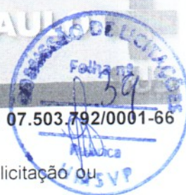
figure como sócia, pouco importando o seu conhecimento técnico acerca do objeto da licitação ou mesmo a atuação no processo licitatório.

3.2.7 – Sociedade estrangeira não autorizada a funcionar no País;