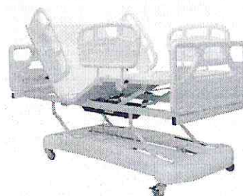
CAMA CONFORTO MOTORIZADA 3 MOVIMENTOS COM ELEVÇÃO DO LEITO EXTRA LUXO - 2774