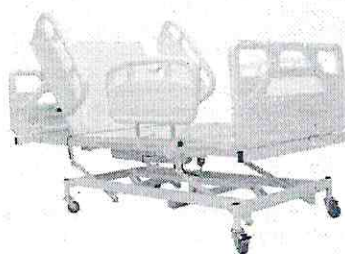
CAMA CONFORTO 3 MOVIMENTOS MOTORIZADA COM ELEVÇÃO DO LEITO - 2767